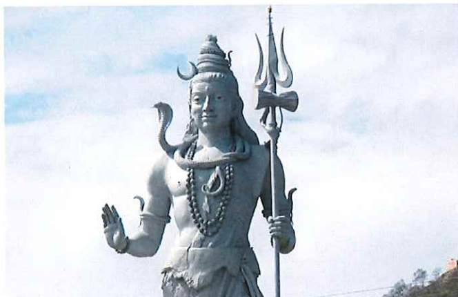
シヴァ神の像(リシケシ)