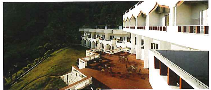
モナルリゾート(ルドラプラヤグ)

モナルリゾートは山間の川のそばに位置しています。 川のせせらぎに耳を澄ませば、心と体が自然とリラックス。 ヨガを味わうのに最適な場所です。