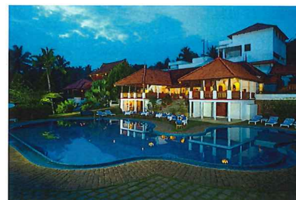
トラヴァンコール ヘリテージ(トリバンドラム)